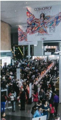
The hugely successful 2014 fair was just a taste of what to expect in the 20th anniversary year of Cosmoprof Asia.

성공적이었던 2014 박람회는 맛보기였다. 2015 코스모프로프 아시아의 20주년 박람회가 기대된다.