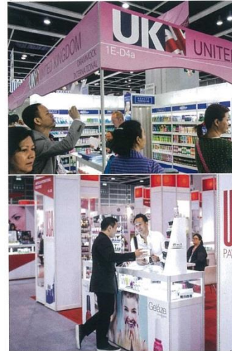
코스모프로프 아시아 20년 동안 프로페셔널 산업의 업데이트와 트렌드 뉴스 그리고 비즈니스장을 제공해왔다.

20년 동안 젊고 멋진 모습 코스모프로프 아시아는 2015년 11월 중요한 기념을 위해 박차를 가하고, 아시아 최대의 국제 미용 무역박람회의 성공적인 개최를 위해 이 모든 것들에 집중하고 있다. 2014년의 수치는 무엇을 기대해야 하는지 아이디어를 제공한다 - 지난해 2,362명의 전시자들이 약 60,000여명의 방문객들과 평방 81,500m 2 의 전시 공간에서 자신들의 제품 및 서비스를 소개하기 위해 홍콩 컨벤션 및 전시장에 도착했다. 42개의 국가 또는 지역을 대표하는 전시자들이 참여하여 매우 국제적인 분위기가였다. 방문객들은 혁신적인 기술과 뷰티 산업의 트렌드를 발견하기 위해 124개의 해외 국가에서 참가하였다. 그리고 이번 박람회와 20년을 기념하며, 이미 지난 20년 보다 4배 증가한 크기와 함께 더 나은 이벤트가 될 것을 약속한다. 미국의 Kiss Products와 Amika를 포함하여 홍콩의 BabyLiss pro 등 최고의 전시자들은 이미 벌써 참가입을 하였다. 특별한 2015 코스모프로프 아시아에는 무엇이 준비되어 있을까? 인기리에 많은 이들이 즐겨찾는 스팟 온 뷰티(Spot on Beauty), 부티크 그리고 국제적인 바이어 프로그램으로 모든 스케줄이 채워질 것이다. 피부, 헤어 및 네일 케어의 분야에서 새롭고 흥미로운 제품을 런칭하고, 스팟 온 뷰티 섹션에서는 남성을 위한 화장품, 아기를 위한 제품, 천연 유기농 제품에 집중하여 "트렌드 발견"이라는 새로운 분야의 혁신성을 소개할 것이다. 또 다른 것을 추가하여, 여기의 상호작용적인 트렌드 포럼은 유로모니터, 그룹 Carin과 Kline과 같은 글로벌 리서치 기업을 통해 최신 동향에 관한 통계와 수치가 공개된다. 한편, 부티크 자선 사업은 여성의 재단 기금을 마련하기 위해 20개 전시 브랜드가 후원하는 여행 크기의 샘플 세트를 판매한다. 그리고 제 9회 인터네셔널 바이어 프로그램은 중국, 인도, 터키 등 세계 각국에서 판매자와 바이어 사이에 긴밀한 B2B 네트워킹을 제공한다.